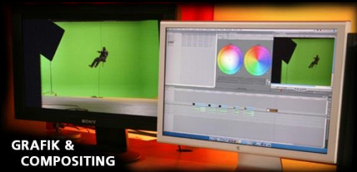
GRAFIK & COMPOSITING