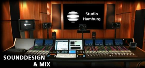
SOUNDESIGN & MIX